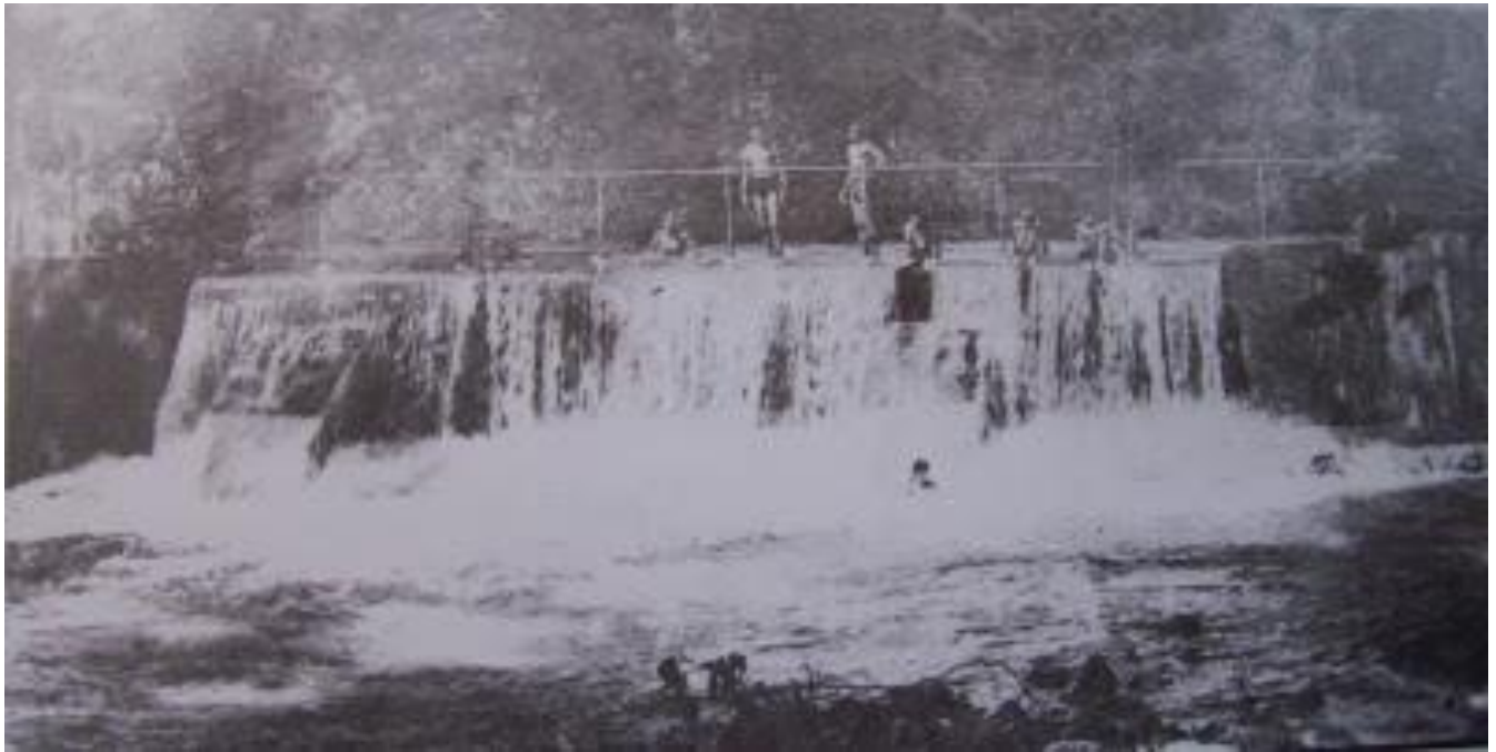
Ilustración 1. Foto del Rio los Chorros. Antiguo Balneario.