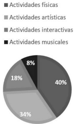
Figura 2. Tipo de hobbies desarrollados durante el confinamiento

La frecuencia de práctica de hobbies (en aquellos que afirmaron desarrollarlos) más común fue la de dos o tres veces a la semana (28.99%), seguida de más de cuatro veces a la semana (26.81%), una vez a la semana (17.39%), una vez a la quincena (6.52%) y por último una vez al mes (2.17%). La Figura 3, muestra la frecuencia de práctica de hobbies.